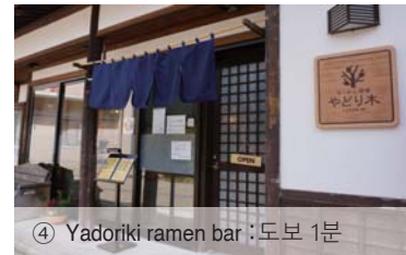
④ Yadoriki ramen bar :도보 1분