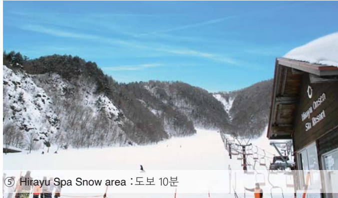
⑤ Hirayu Spa Snow area :도보 10분