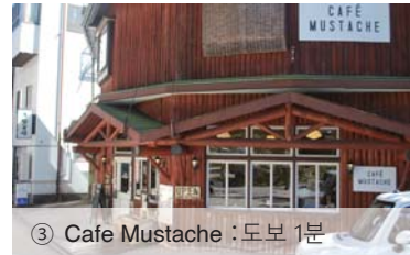
③ Cafe Mustache :도보 1분

히라유 온천 나카무라관 기후현 다카야마시 오키히다온센고 히라유 728번지 TEL +81(0) 578-89-2321 FAX +81(0) 578-89-3022