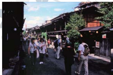
Takayama ~ 飛騨高山 ~ 버스로 55 분