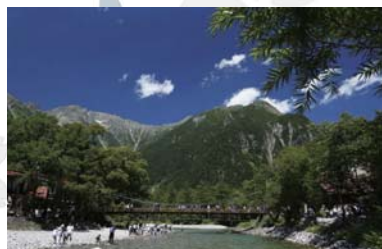
Kamikouchi ~ 上高地 ~ 버스로 25 분