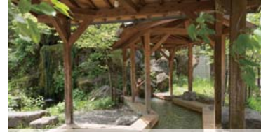
② Hirayu Ashi-yu :도보 1분