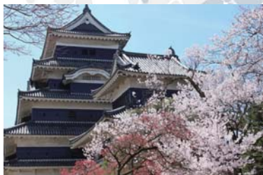
Matsumoto-castle ~ 松本城 ~ 버스로 75+10 분