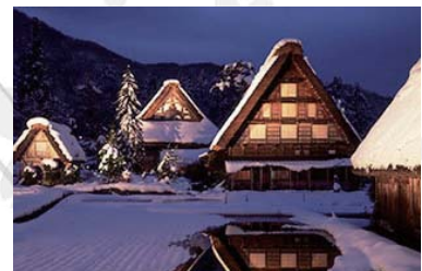
Shirakawa-go ~ 白川郷 ~ 버스로 55+50 분