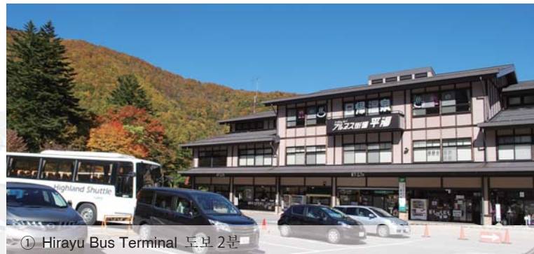
① Hirayu Bus Terminal 도보 2분

일본의 역사를 느끼게 하는 히다고산이나 세계유산 의 시라카와고를 비롯하여 웅대한 자연을 트레킹을 해 만끽할 수 있는 가미코치, 노리쿠라다케, 신호다카 등예의 액세스에 대단히 편리합니다.