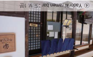
④ Yadoriki ramen bar : 도보 10분