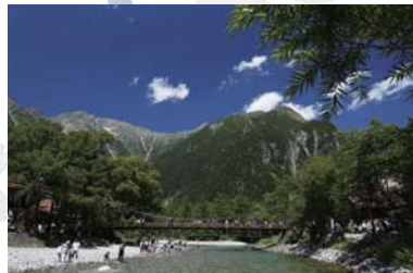
Kamikouchi ~ 上高地 ~ 버스로 25 분