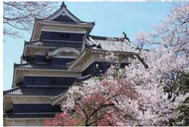
Matsumoto-castle ~ 松本城 ~ 버스로 75+10 분