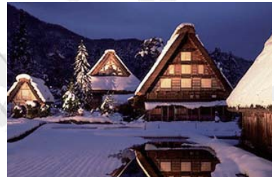
Shirakawa-go ~ 白川郷 ~ 버스로 55+50 분