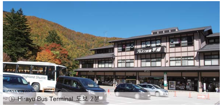
① Hirayu Bus Terminal 도보 2분

일본의 역사를 느끼게 하는 히다고산이나 세계유산의 시라카와고개를 비롯하여 웅대한 자연을 트레킹을 해 만끽할 수 있는 가미코치, 노리쿠라다케, 신호다카 등에서의 액세스에 대단히 편리합니다.