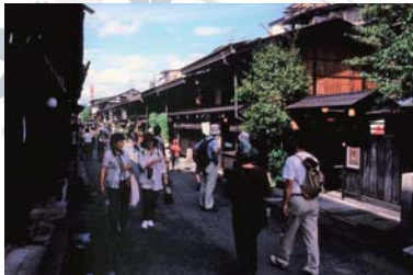
Takayama ~ 飛騨高山 ~ 버스로 55 분