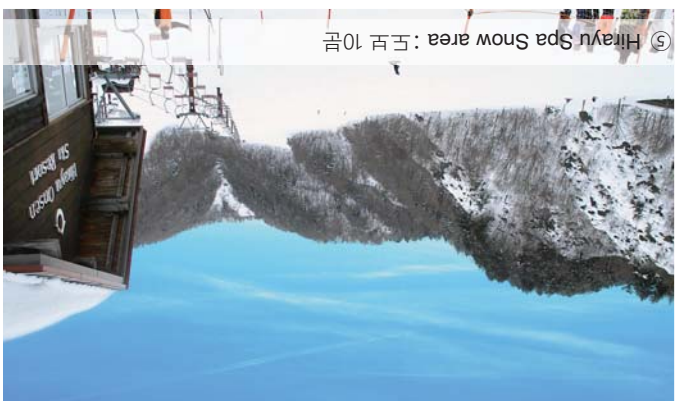
⑤ Hirayu Spa Snow area : 도보 10분