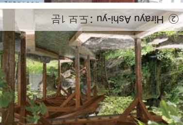
② Hirayu Ashi-yu : 도보 10분