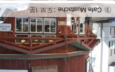
③ Cafe Mustache : 도보 10분