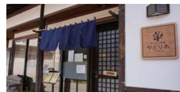
④ Yadoriki ramen bar：步行 1 分钟

平汤温泉 中村馆 岐阜县 高山市 奥飞騨 温泉乡 平汤 728 番地 TEL +81(0) 578-89-2321 FAX +81(0) 578-89-3022