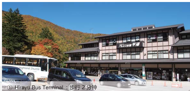
① Hirayu Bus Terminal：步行 2 分钟

通往让您感受日本历史的飞騨高山，世界遗产的白川乡，能环山漫游充分享受雄伟自然的上高地，乘鞍岳新穗高，等等，非常方便。