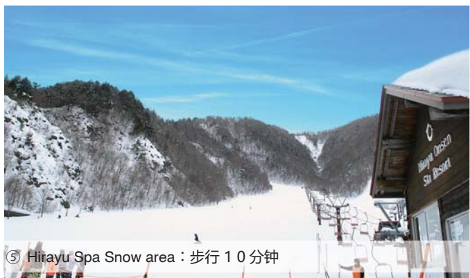
⑤ Hirayu Spa Snow area：步行 10 分钟