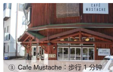
③ Cafe Mustache：步行 1 分钟