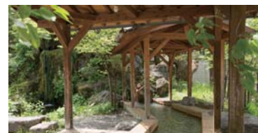
② Hirayu Ashi-yu：步行 1 分钟